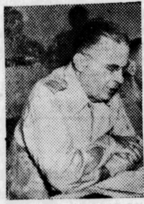
Van Mook ketjeva.....?