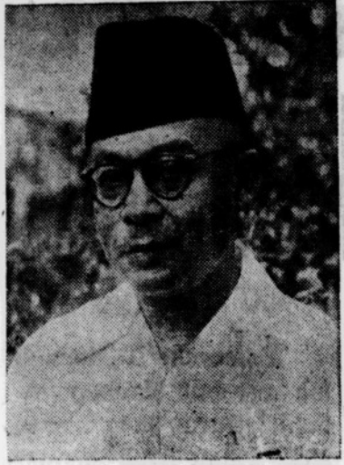
Mengadakan perhubungan diplomatik.

Menurut Suripno sendiri, demikian Hatta, perdjandjian dengan Rusia itu belum berarti